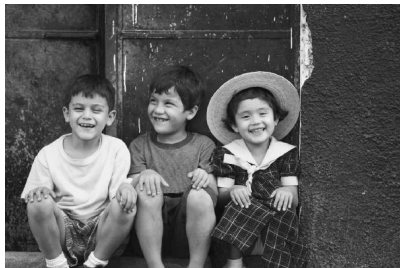
Epska fantazija v vas zbudi srečnega otroka.