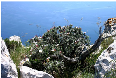
Naš svet je iz goste materije

Sehir bar Jemin, kratko imenovana Knjiga, je skrivnostno vilinsko delo, pravzaprav posebna knjiga urokov. Nihče ne ve natančno, kdaj se je ta