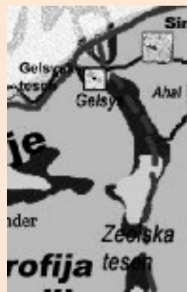
Območje dogajanja v zgodbi Junaški boj Zeolije

V zgodbi, ki bo objavljena sredi marca, je opisan ta junaški boj.