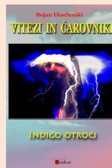
Naslovnica Indigo otrok

Pozdravljeni Indigo otroci je odlična knjiga Zelo me je navdušila in še bolj sem vesela da se je tudi kakšen slovenski avtor lotil takšne vrste del Vse pohvale le tako naprej - komaj čakam na nadaljevanja Lp Sara