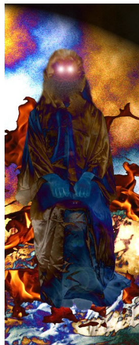
Prestol Temnega carja v Medsvetu.

»Predstavitve po Sloveniji so nujne zaradi promocije žanrskega prvenca.«