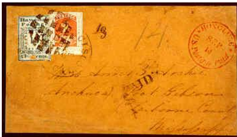
Pismo iz leta 1851, 13 centov, modra, mešana frankatura

izmed enajstih, ki imajo nalepljeno znamko za 5 centov. Ta poštnina je veljala na teritoriju Havajev. Pod rdečim žigom pošte Honolulu se nahaja temnorjav žig z oznako "SHIP 6". To je bilo potrdilo, da je plačana poštnina tudi za dostavo pisma po teritoriju ZDA. Ko je pismo prispelo na cilj, je bil odtisnjen žig San Francisca in kapitanu so izplačali 2 centa za njegovo skrb. Njegova današnja cena je okrog 50.000 dolarjev.