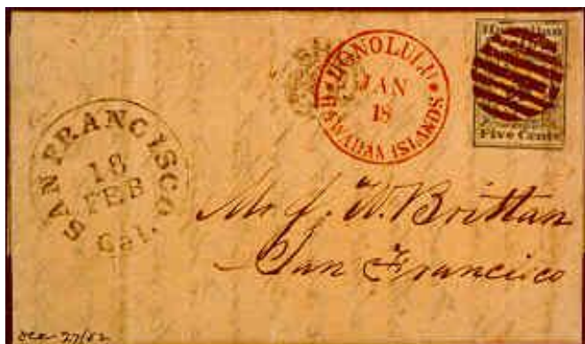
Pismo iz leta 1851, 5 centov, modra