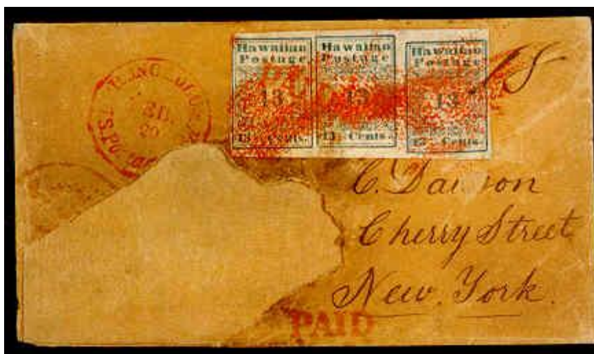
Pismo iz leta 1851, 3x13 centov, modra, "dawsonova najdba"

Na prikazanem pismu (pismo iz leta 1851, 13 centov, modra, mešana frankatura) sta nalepljeni dve znamki, misionarka za 13 centov iz prve serije in znamka z likom kralja Kamehameha III za 13 centov. Ker je bilo pismo težje od ene unče, je bilo potrebno nalepiti dvakratno poštnino. Pri tem pa je prišlo do pomote, saj je bilo potrebno kapitanu plačati 2 centa za vsako pismo ne glede na njegovo težo. Tako je to pismo preplačano za 2 centa. Današnja cena tega pisma je preko 90.000 dolarjev.