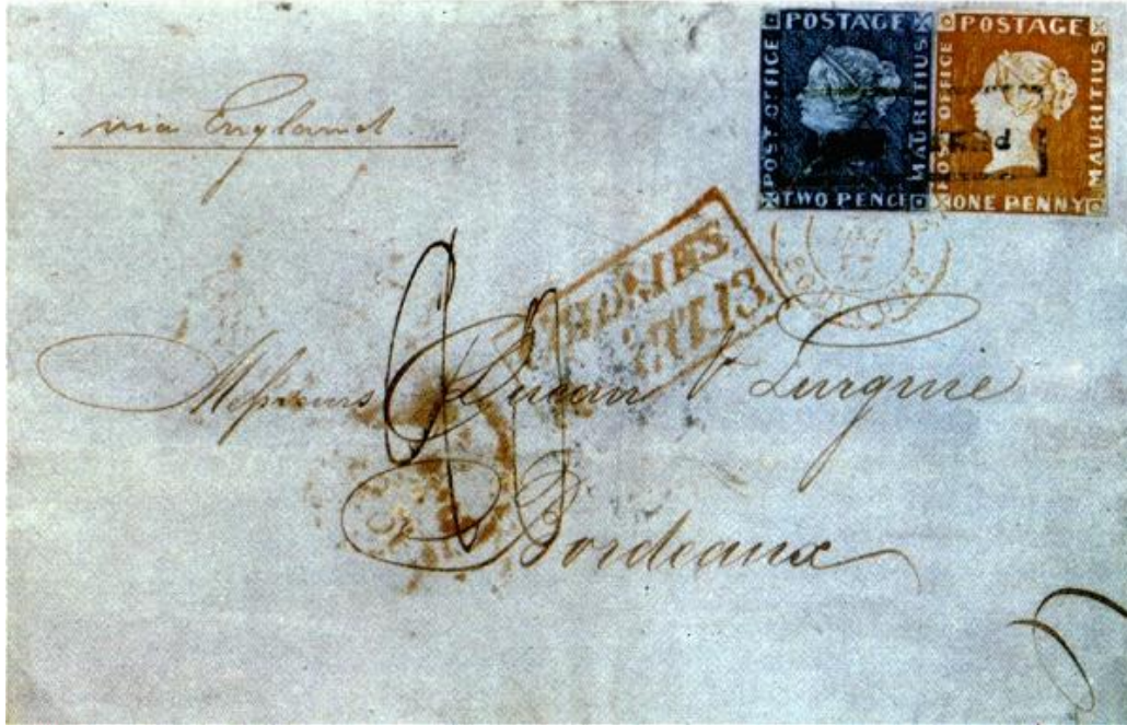
Bordojsko pismo je v lasti nizozemskega poštnega muzeja in zanj so plačali 3,8 milijona dolarjev