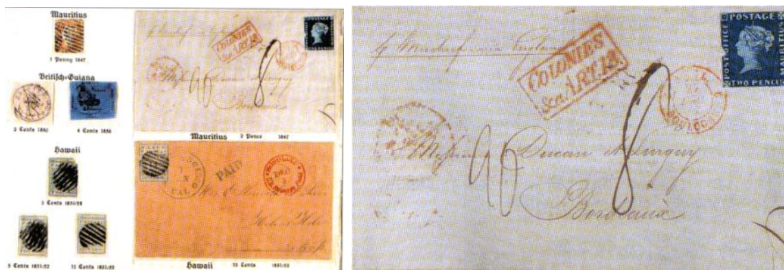
Nemška plošča in pismo z modrim mavricijusom

Čez pismo je zapisana velika osmica. To pomeni, da je bilo pismo na vrhu paketa, ki je bil osmi po vrsti. Tako so označevali pakete, da bi na sprejemni pošti lahko preverili količino poštnih paketov. Na pismu pa je še ena posebnost - znamka ni žigosana! Na pošti v Port Louisu poštar ni pritisnil žiga. Šele v Bordeauxu je francoski poštar opazil, da je znamka nežigosana. Pritisnil je žig in - tudi sam zgrešil!