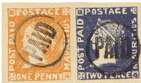
Oranžni in modri mavricijus - druga izdaja - POST PAID

Razlika je torej 1 kos, prav tako se razlikuje število žigosanih in nežigosanih modrih mavricijusov. To bodo morali v filatelističnih krogih še doreči. Vendar se v večini literature navaja vrednost 26 znamk.