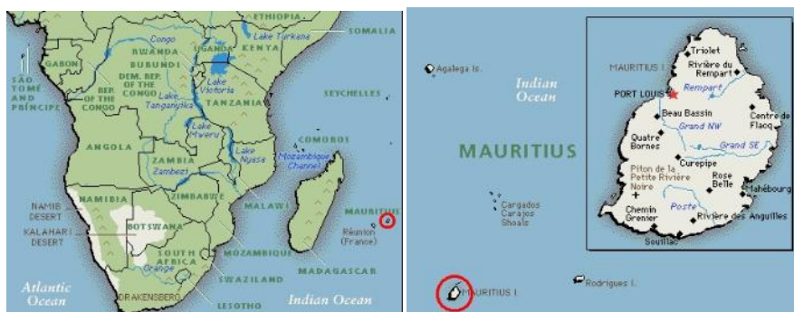
Položaj otoka - Indijski ocean, vzhodno od Madagaskarja (zemljevidi iz Microsoft Encarta 99)

Preden se lotimo zgodbe, je potrebno še nekaj povedati o samem otoku. Mavricijus, rajski otok v Indijskem oceanu, je dolg le 65 km in širok 48 km. Leži 800 km vzhodno od večjega otoka Madagaskarja na vzhodni strani Afrike in 20° južno od ekvatorja. Ima 160 km prekrasnih peščenih plaž in je v notranjosti posejan z nepreglednimi plantažami sladkornega trsa ter banan. To je sanjski cilj marsikaterega turista, še bolj pa kakšnega navdušenega filatelista.