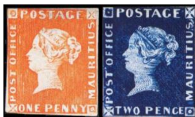
oranžni (1p) in modri (2p) mavricijus - POST OFFICE

Na svetu obstaja več kot pol milijona različnih znamk. Toda nobena od njih ne očara bolj, ne samo filateliste, temveč tudi ostale poznavalce in kapitalne investitorje, kakor znamka otoške države Mavricijus z napisom POST OFFICE. Pravzaprav sta to dve znamki, oranžni mavricijus z vrednostjo 1 penija in modri mavricijus z vrednostjo 2 penijev. Zelo neugledni znamki! Le kaj je tako privlačnega, da so zanj pripravljeni plačati tako pravično vsoto dolarjev?