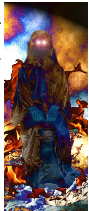
Prestol Temnega carja v Medsvetu.

»Konvencije so zanimiv način spoznavanja scene«