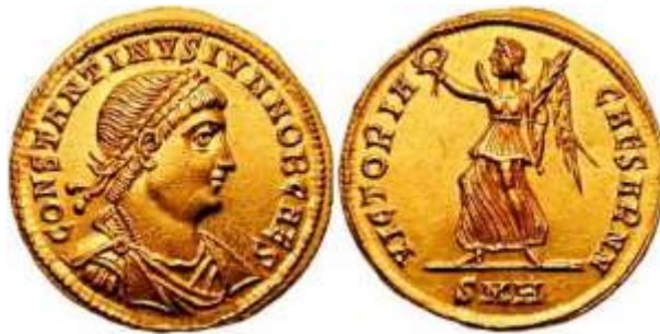
Kovanec »solidus«, ki ga je izdal cesar Konstantin leta 312. Vseboval je 4,5 grama zlata. V uporabi je bil v vzhodnem Rimskem cesarstvu vse do 10. stoletja.

V bistvu je novopečeni »publicani« na ta način Rimski državi dal svojevrstno posojilo. Po preteku zakupnega obdobja, mu je država plačala obresti na posojeno vsoto. »Publicani« je potem poskrbel, da si je s pobiranjem davkov povrnil posojilo. Ob koncu obdobja je smel obdržati tudi višek pobranih sredstev, ob tem pa je prejel še državne obresti. Seveda pa je posojilodajalec tvegat, da bo zbral premalo davkov. Tudi davkov ni smel preveč povečevati, ker je tvegat nemire. V tem primeru se je lahko zgodilo, da mu je država pooblastilo za zbiranje davkov odvzela.