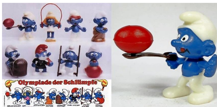
Smrkčevska olimpijada iz leta 1984 stane med zbiralci skupaj z lističem BPZ okrog 1.500€. Posamezna figurica stane okrog 80€, smrkec z jajcem pa 10x več! Listič prinese dodatnih 100€.

Dragocenost lahko ocenite tudi sami. Najprej morate vedeti, če je bila igračka narejena pred letom 1980. Potem je pomembna barva plastične kapsule. Večina je rumenih, nekatere so oranžne. Če je oranžna, so v njej shranili ročno pobarvane Ovce in Smrkce. Prav ti modro obarvani palčki z belo kapico sodijo med najbolj iskane in zaželene zbirateljske predmete, še posebej z BPZ lističem. Pomembno je še, kje so figurice naredili. Večjo vrednost dosegajo tiste, ki so jih izdelali v Italiji ali Nemčiji. Na internetu je mogoče najti zbirateljske kataloge s cenami in tam lahko izveste zbirateljsko ceno posamezne figurice.