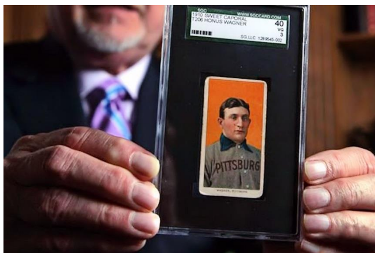
Sličica T206 Honus Wagner igralca baseballa je bila prodana za 1,26 milijona dolarjev.

Ko se vaši otroci naveličajo zbiranja sličic košarkarjev, nogometašev, ipd., vam svetujem, da albume skrbno shranite. Morda bodo vašemu vnuku ali vnukinji prinesli pravo bogastvo. Trg zbiralcev športnih sličic je zelo velik in določene sličice dosegajo neverjetne cene. Seveda je najbolj cenjen ameriški trg, kjer so neprekosljivo na prvem mestu sličice igralcev baseballa. Menda je bil med njimi najbolj cenjen igralec nemškega porekla Johannes Peter Honus, ki so ga klicali The Flying Dutchman. Igral je v letih od 1897 do 1917. American Tobacco Company je leta 1933 izdala album s sličicami in med zadnjimi je sličica T206 Honus Wagner. Kolikor je znano, so natisnili od 60 do 200 kosov te sličice, saj je lastnik športne ekipe Wagner zahteval avtorsko nadomestilo za tiskanje. Družba se je odločila, da tega ne bo plačala in je prekinila tiskanje. Zato je ta košček potiskanega papirja že takoj na začetku dosegel ceno 50$. Leta 2000 je zbiralec za eno izmed njih plačal 1,26 milijona $. Poznavalci ocenjujejo, da bi bila danes cena 3x višja!