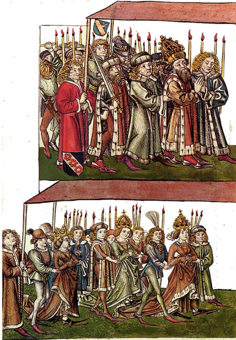
Slika 3 - Sigismund Luksemburški in Barbara Celjska na koncilu v Kostanzi

Leta 1451 je Friderik II. Celjski na prošnjo celjskih meščanov priznal Celju vse pravice kot so jih sicer imela druga štajerska mesta. Določil mu je pomerij, oprostil meščane plačila davka od prodaje vina, jih odvezal obvezne prodaje dvorskega vina in tlake, še vedno pa so morali sodelovati pri gradnji obzidja.