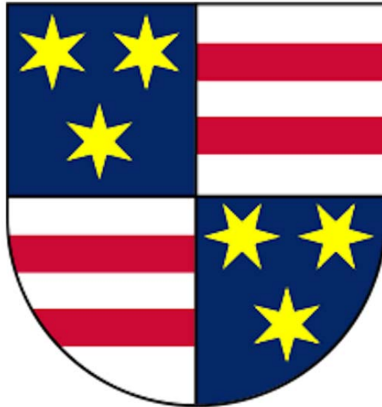
Slika 1 – grb Celjskih knezov

Leta 1415 jim je cesar podelil nov grad Pliberk s pripadajočim posestvom, ki so ga Celjani pustili Habsburžanom zaradi nevarnosti izbruha vojne. Sigismund je dobro razumel njihovo gesto in uslugo brž poplačal s podelitvijo pravice do krvnega sodstva v Celjski grofiji.