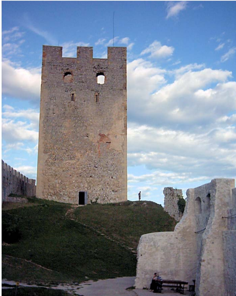
Slika 2 – Friderikov stolp, ostanki mogočnega gradu Celjskih

Sigismund Luksemburški je nasledstvo cesarske krone, Ogrske, Češke ter Zgornje in Spodnje Avstrije zagotovil svojemu zetu Albrehtu V., ki je postal rimsko-nemški kralj Albreht II., a razmeroma mlad umrl še pred rojstvom svojega prvega sina Ladislava. Celjani so imeli trdne sorodstvene zveze z Luksemburžani, ki so na prelomu 15. stoletja v rokah držali cesarsko krono.