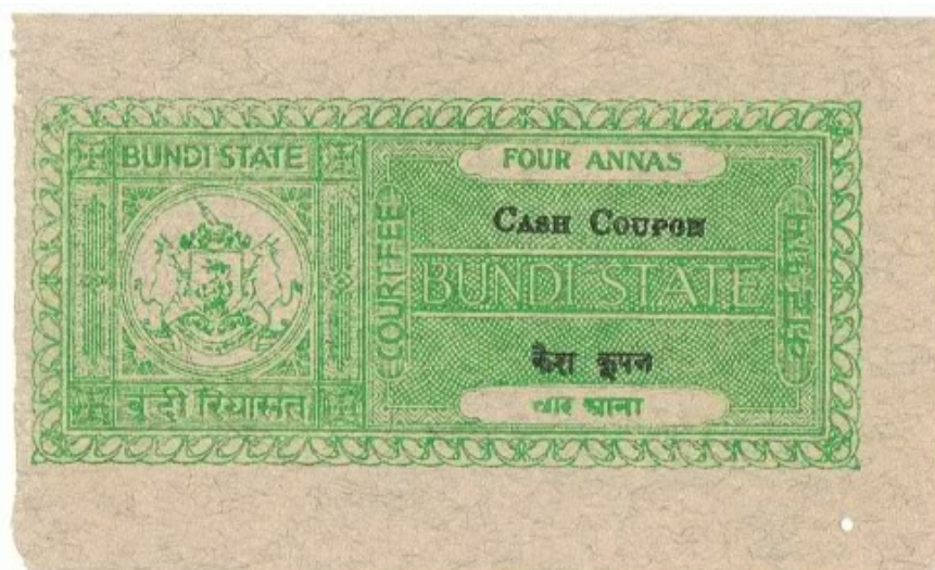
Slika 2 - »CASH COUPON BUNDI STATE«, znamka kot začasni denar indijske države Bundi

Podobno so ravnali v Franciji. Monaku, Belgiji, Avstriji, Nemčiji, Argentini, Grčiji, Italiji in na Norveškem med prvo svetovno vojno, ponekod pa celo po njej. V Rodeziji so v vojnih letih od 1898 do 1900 izdelali razglednice in nanje nalepili znamke. Te razglednice z znamko so uporabljali namesto kovancev. Podobno je bilo na Madagaskarju med prvo svetovno vojno in v Španiji med državljansko vojno 1936 do 1939. V Rusiji in Ukrajini so v obdobju od leta 1915 do 1917 natisnili na karton podatke o denarju ter vrednosti in dolepili znamko ustrezne nominalne.