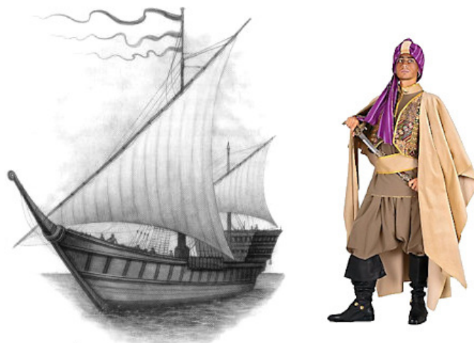
Tipična dvojamborna arabska trgovska ladja iz 10. stoletja imenovana dhow in »filmski« prikaz lika Sinbada Morjeplovca.

V sedemnajstem stoletju je na Maldivih doživel brodolom Pyrard de Laval, francoski morjeplovec. Na otokih je živel dve leti. Zapisal je: »Imenujejo jih boly in jih izvažajo po vsem svetu v neskončnih količinah. Lani sem videl, da so natovorili trideset ali celo štirideset ladij samo z njimi. Na teh ladjah sploh ni bilo nobenega drugega tovara. Vse te ladje so menda odplule v Bengal, ker tam je povpraševanje po njih veliko, čeprav so cene visoke. V Bengalu jih uporabljajo kot denar, četudi imajo dovolj srebra in zlata ter še druge kovine. Kar se mi zdi še bolj nenavadno je to, da veliki trgovci in drugi bogataši na hitro gradijo skladišča zanje, prave zakladnice. Dejansko imajo te školjke zanje zakladno vrednost.«