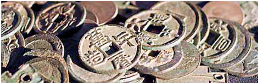
Kovanci »kavri« s katerimi je želel cesar Xian leta 335.p.n.š. zamenjati polžje hišice kavri.

V notranjosti Kitajske je kavrijev vedno bolj primanjkovalo. Ko se je razvila metalurgija in so pričele različne civilizacije obdelovati kovine, so se pojavili tudi prvi nadomestki dragocenih polžjih lupinic. Vse se je spremenilo po letu 481 pred našim štetjem. Kraljestvo Zhou je razpadlo na tri manjša kraljestva (Wei, Han in Zhao), ki so se med seboj stalno bojevala. V tem času se je razvila tehnologija pridobivanja železa in kljub vojni je zelo narasel standard življenja. Cesar Xian iz kraljestva Zhao, ki je uvedel lokostrelce kot posebno bojno enoto, je okrog leta 335 pred našim štetjem (p.n.š.) prepovedal uporabo kavrijev kot menjalno sredstvo, saj je želel, da bi se namesto njih uveljavili njegovi bakreni novci.