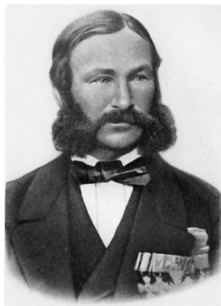
Heinrich Barth (1821-1865), nemški raziskovalec osrednje Podsaharske Afrike in Sudana.

Na vzhodnih afriških obalah so kavrije nabirali v velikih množinah. Lupinice so navrtali in jih nanizali na vrvice. Vsaka je vsebovala od 40 do 100 polžjih hišic. Tako je petdeset ali dvajset nanizanih vrvic predstavljalo 200 hišic in prodajali so jih za en britanski šiling. To je bilo menjalno razmerje med obema valutama okrog leta 1850.