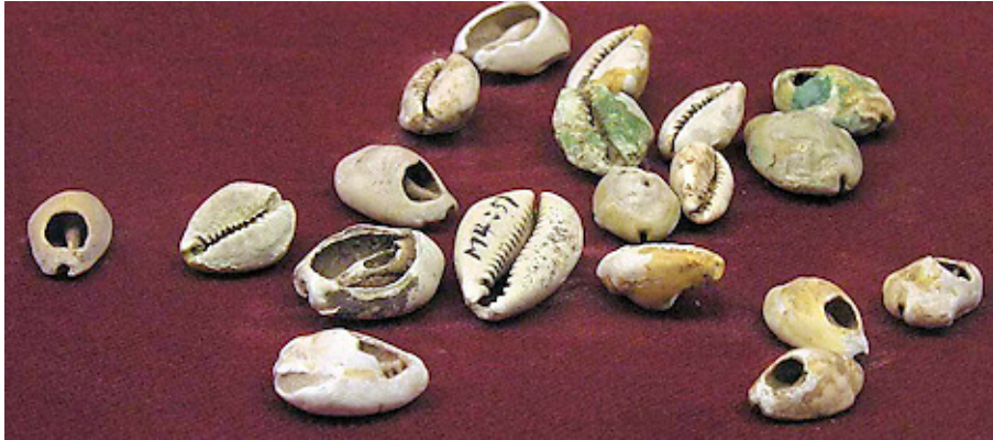
Kavrije so pogosto obrusili, da se je na zgornji strani pokazala notranjost polžje hišice in jo je tako bilo lažje nanizati na vrvico ali kovinski obroček.

velikost in so po velikosti smeli odstopati največ za okrog tri milimetre. Manjše kavrije so gojili v lagunah in jih uporabili šele, ko so bili predpisano veliki. Gojenje kavrijev so smele opravljati samo ženske. Te so z dolgotrajno vadbo dosegle, da so se neovirano potapljale na precejšnjo globino.