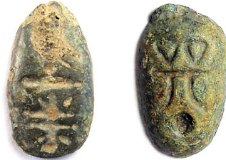
Kovanec »za v nos«, levo mravlja (pi-ch'ien), desno duh (kuei-lien-ch'ien).

pomeni »mravlja za v nos«. Uporabljali so jih namreč pri pogrebih. Umrlemu so v nosno odprtino z notranje strani potisnili ta »kovanec«, da so preprečili mravljam, da bi pokojniku zlezle skozi nos v telesne votline. Ob tem je revež imel še s čim plačati v onostranstvu. V nekaterih predelih so na »kovanec« odtisnili obraz duha in jih imenovali kuei-lien-ch'ien (duh v nosu).