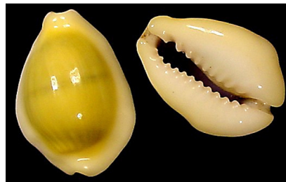
Kavri (Cypraea moneta)

Polžje hišice različnih vrst polžev so se v zgodovini uporabljale za denar v več različnih delih sveta. Nastanek denarja ima korenine prav tukaj. Še danes ga uporabljamo pri izdelavi okrasja in za določene ceremonialne namene. A med njimi je najpomembnejši Kavri ( Cypraea moneta ).